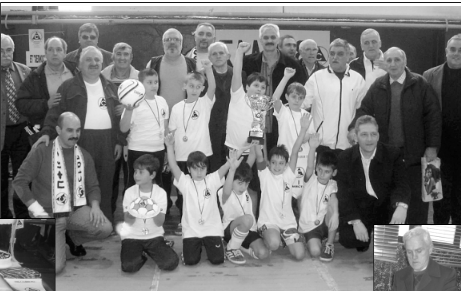
Снимка за спомен на организаторите от Козлодуй и новите шампиони