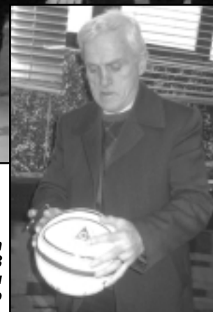
Легендарният Михаил Мишев оставя своя автограф