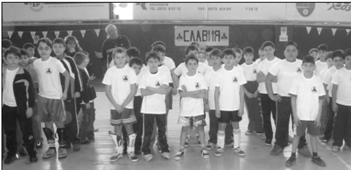
За шеста поредна година 60 деца от Козлодуй прегърнаха идеята "Славия"