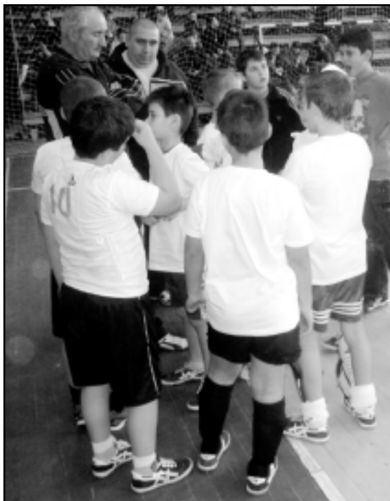
Малките футболисти слушат указанията на своя наставник