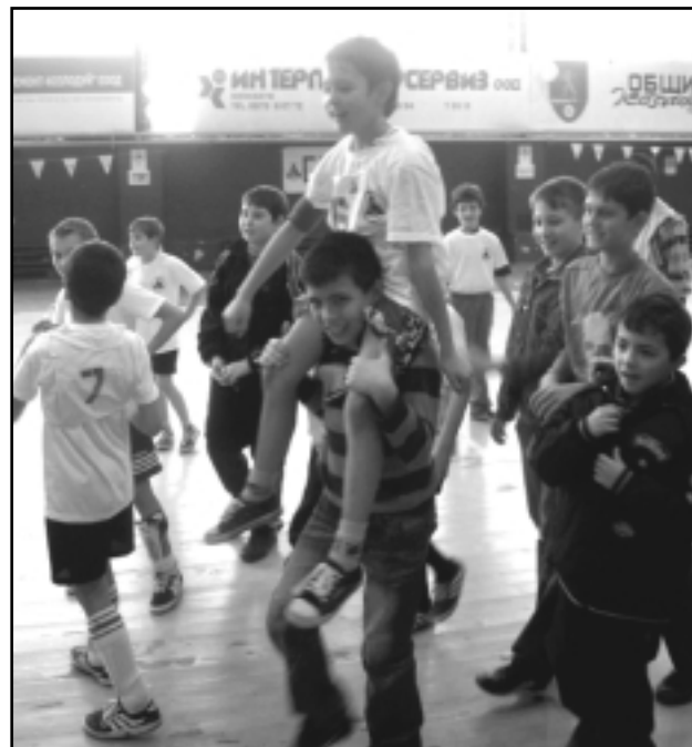
Феновете на СОУ "Христо Ботев" са понесли на ръце своя герой