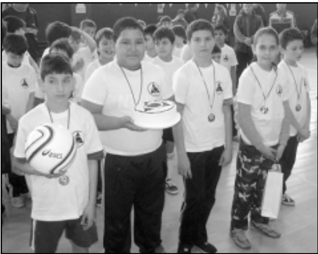
Достойните финалисти от НУ "Васил Левски"