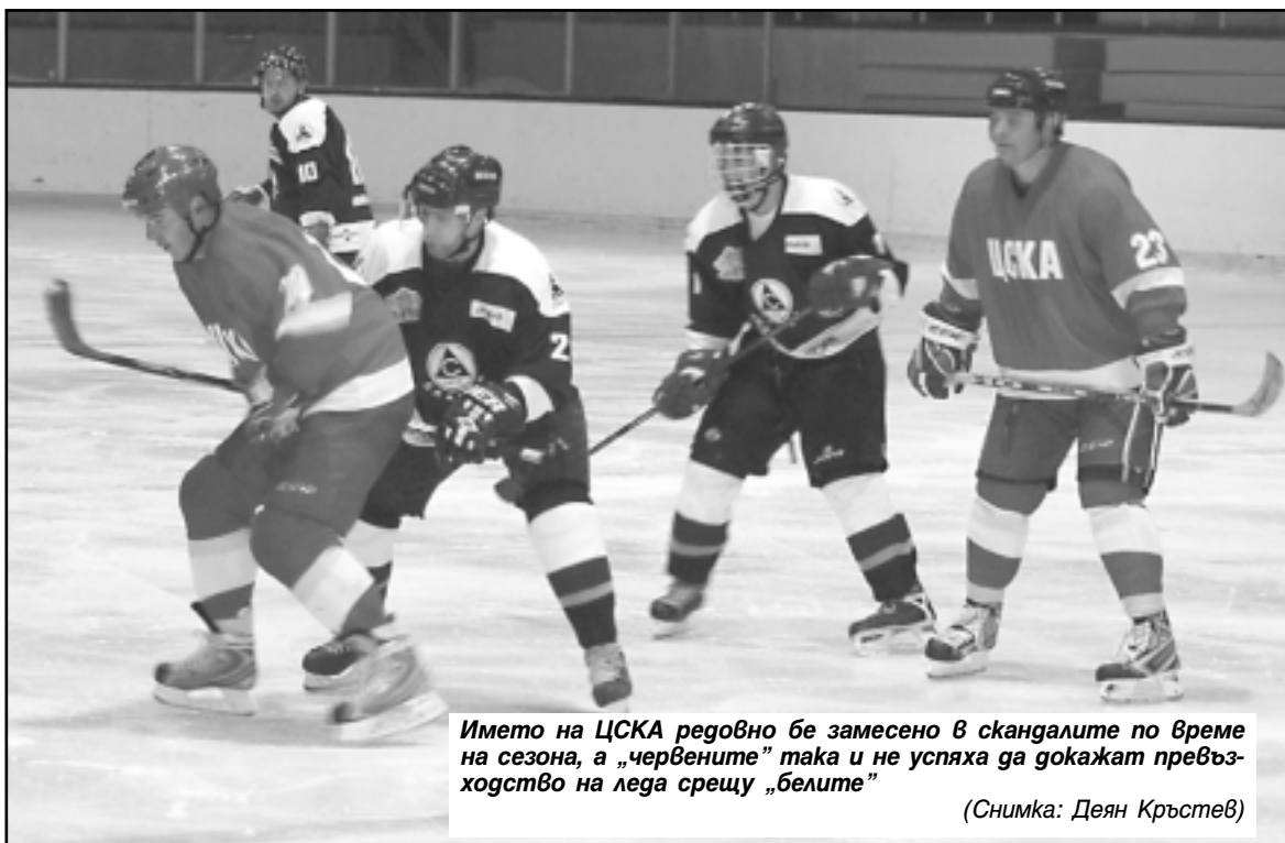
Името на ЦСКА редовно бе замесено в скандалите по време на сезона, а „червените“ така и не успяха да докажат превъзходство на леда срещу „белите“