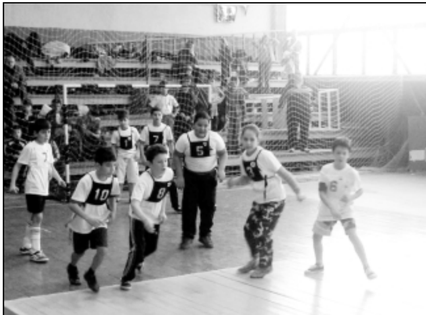
Борбата е за всяка педя земя, а погледите на всички са насочени към топката