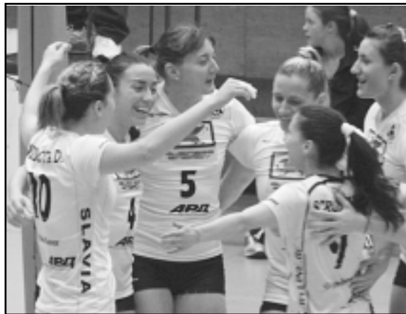
„Славия“ спечели точно 434 точки в петте си мача в турнира за купата на България

В първия си мач от груповата фаза вицешампионките стигнаха до трудна победа с 3:1 срещу „Енерджи-Калиакра“. Единствено в третия гейм те успяха да спечелят категорично с 25:17, а в останалите части разликата за от-