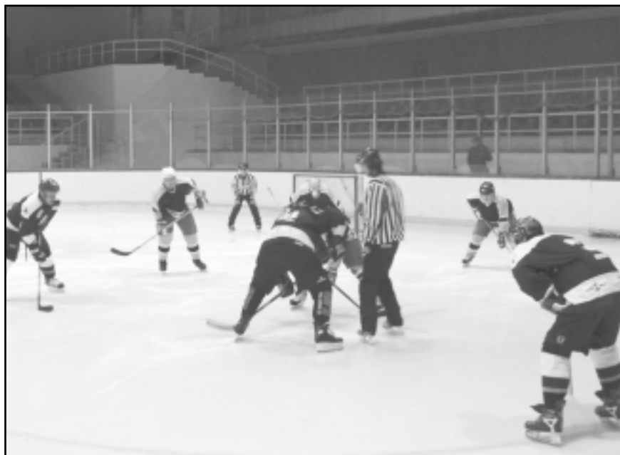
„Славия” не среща никакви трудности срещу „Спартак” във всичките сблъсъци помежду им

Освен титлата при мъжете „Славия” си осигури първото място в три от четирите възрастови групи - за деца до 12 г., за деца до 14 г. и за юноши младша възраст до 16 г. Решителният мач за определяне на шампиона при най-големите - юношите старша възраст до 18 г., ще се състои на стадиона на „белите” на 14 февруари. Дори при за-