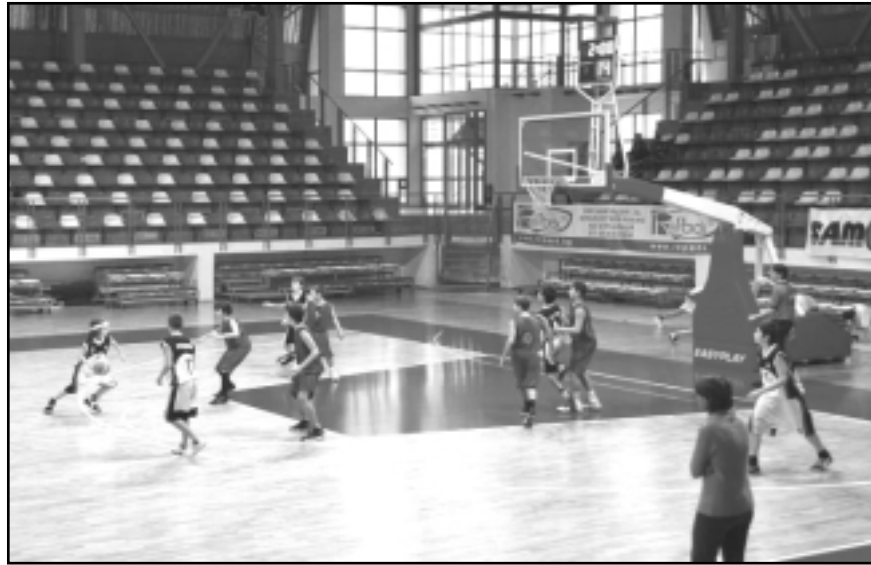
Атаката си остава най-силното оръжие и на младите баскетболисти в бяло

столицата нашият отбор, във възрастовата си група мини баскет