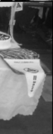
И тази година наградите бяха повече от внушителни