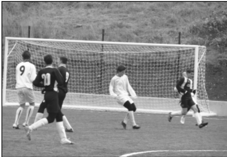
„Белите“ надежди ще се стремят към максимално добри изяви на турнира в италианската столица, който се очаква да бъде наблюдаван от съгледвачи на реномирани европейски клубове